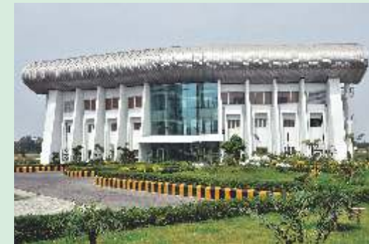
>> Front view of the Cricket Pavilion