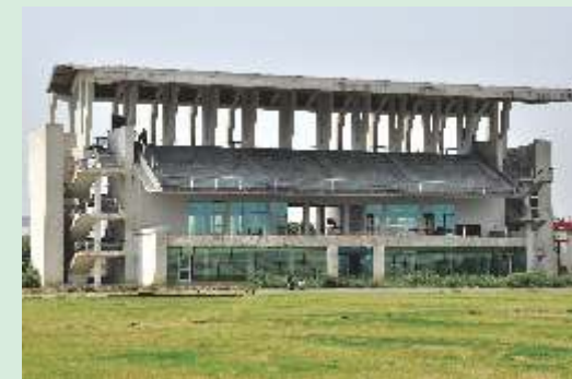
>> Athletic Pavilion